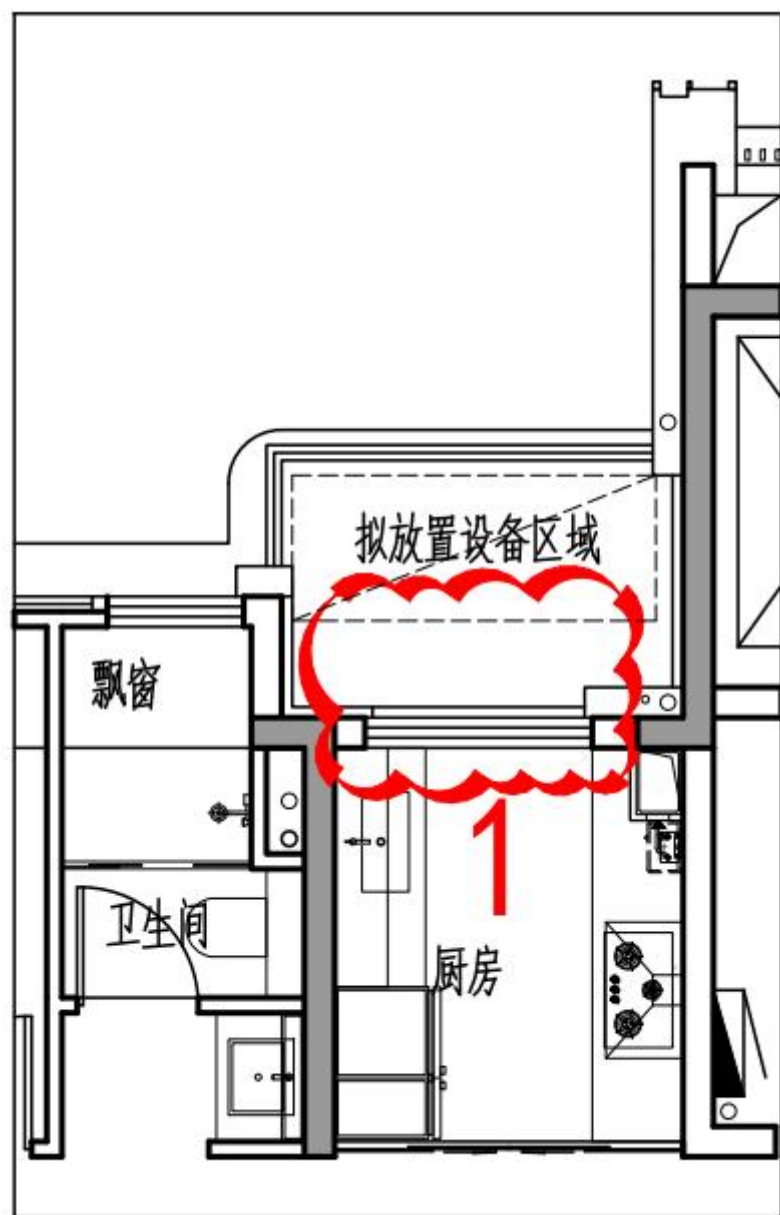
3#住宅 二~十六层局部平面图（变更前）