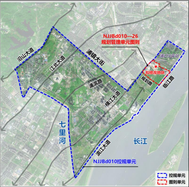
本图则在NJJBd010单元的位置