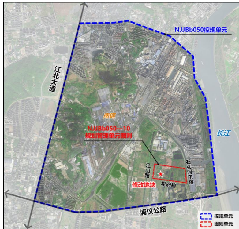
本图则在NJJb050单元的位置