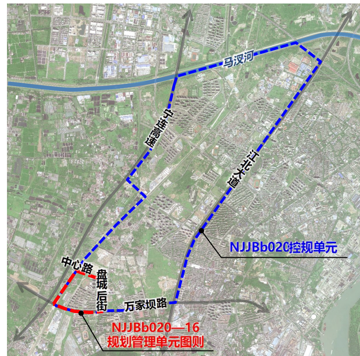
本图则在NJJb020控规单元的位置